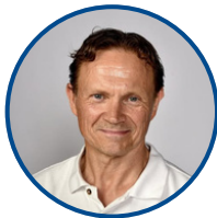
ヘイッキ・ソイニ