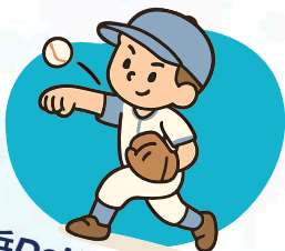
横浜DeNAベイスターズ